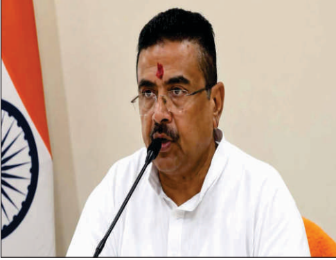
স্টাফ রিপোর্টার, রোজদিন

ক্ষমতায় এসেই বাংলাদেশিদের তাদের দেশে পাঠানোর কথা