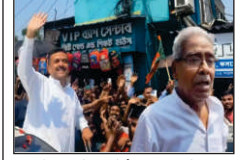
স্টাফ রিপোর্টার, রোজদিন

মুখ্যমন্ত্রী শুভেন্দুকে স্বাগত জানাতে হাজির ডায়মন্ডহারবারের তৃণমূল বিধায়ক, নামল জনতার ঢল