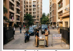
স্টাক রিপোর্টার, রোজদিন

রাজ্যে বিধানসভা নির্বাচনের ঠিক দু'দিন আগে নজিরবিহীন কড়া কড়ি শুরু করল নির্বাচন কমিশন। অবাধ ও শান্তিপূর্ণ ভোট নিশ্চিত করতে এবার সরাসরি সাধারণ মানুষের অন্দরমহলের ওপর নজরদারির নির্দেশ জারি করা হয়েছে। মদের দোকান বন্ধ এবং বাইক চলাচলে নিষেধাজ্ঞার পর এবার বহুতল আবাসনগুলোতেও 'বহিরাগত' ফতোয়া জারি করল কমিশন। ইতিমধ্যেই পুলিশকে প্রতিটি বহুতল আবাসনের 'গেস্ট রেজিস্টার' খতিয়ে দেখার নির্দেশ দেওয়া হয়েছে। নজরদারি নিশ্চিত করতে পুলিশ বাড়ি বাড়ি তদ্বাশি বা গেটে তদ্বাশিও চালাতে পারে বলে ইঙ্গিত মিলেছে। ২৩ তারিখ থেকে শুরু হওয়া এই দুই দফার নির্বাচনে কমিশনের এই 'লৌহবর্ম' কতটা কার্যকর হয় এবং বাংলার ভোট কতটা অবাধ হয়, এখন সেটাই দেখার। মঙ্গলবার প্রশাসনের পক্ষ থেকে জানানো হয়েছে, ভোট চলাকালীন রাজ্যের বহুতল আবাসনগুলোতে শুধুমাত্র সেই বিধানসভা কেন্দ্রের নথিভুক্ত ভোটাররাই থাকতে পারবেন। কোনও আত্মীয়-স্বজন বা বন্ধু-বান্ধব জো বটেই, এমনকি ভিন রাজ্য বা অন্য এলাকা থেকে আসা কেউ যদি সেখানে অবস্থান করেন, তবে তাঁদের বিরুদ্ধে কঠোর ব্যবস্থা নেওয়া হবে। অনেক আবাসনের ভেতরেই