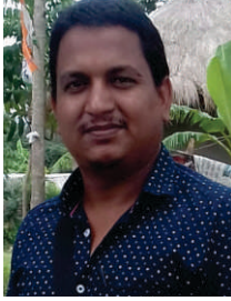
মৃত্যুঞ্জয় সরদার (পনেরো পর্ব)

গ্রাম ছেড়ে বেরোতেই হবে, সৈঁধোতেই হবে দক্ষিণ রায়ের ডেরায়। বনবিবি রাখলে, মারে কোন বাঘে? এ সুন্দরবনের জীবন্ত ইতিহাস, সুন্দরবনের ঝড়খালির দুই নম্বরে ফকির