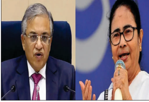
স্টাফ রিপোর্টার, রোজদিন

বিধানসভা নির্বাচনের নির্ধৃত ঘোষণা করে দিয়েছে নির্বাচন কমিশন। আর তারপরই প্রার্থী তালিকা ঘোষণা করতে শুরু করে বিরোধী দলগুলি। যদিও আর্থিক প্রার্থী তালিকা প্রকাশ করে বিরোধীরা। সেখানে পূর্ণাঙ্গ প্রার্থী তালিকা প্রকাশ করে তৃণমূল কংগ্রেস ব্যাকফুটে পাঠিয়ে দেয় বিরোধীদের।