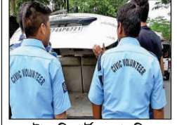
স্টাফ রিপোর্টার, রোজদিন

সিডিক ভলান্টিয়ারদের বোনাস বাড়ল রাজ্য সরকার, ভোট মরশুমে মাস্টারস্ট্রোক