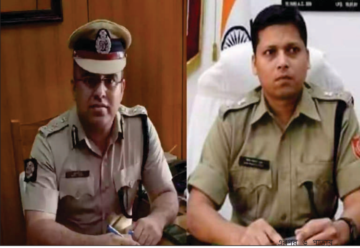
০৫ মার্চ ২০২৬