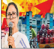
স্টাফ রিপোর্টার, রোজদিন

রাজ্যে রান্নার গ্যাসের তীব্র সংকট মোকাবিলায় নবান্নের জারি করা নির্দেশিকা বা এসওপি মেনে ময়দানে নামল পুলিশ ও এনফোর্সমেন্ট ব্রাঞ্চ। শুক্রবার সকাল থেকেই কলকাতা এবং জেলাগুলিতে বিভিন্ন গ্যাস সরবরাহকারী সংস্থার গুদাম ও অফিসে দফায় দফায় অভিযান চালানো হয়। কোথায় কত সিলিভার মজুত আছে, জোগানই বা কতটা, সবটাই খতিয়ে দেখছেন আধিকারিকরা। কালোবাজারি রুখতে কড়া