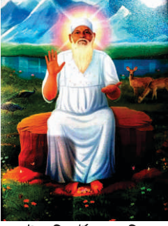
স্টাফ রিপোর্টার, রোজদিন

সব পুণ্য আত্মাদের আমার নমস্কার, আজ *আত্মার মায়ের কষ্ট* আপনাদের সামনে ব্যক্ত করতে চাইছি। আজ মা এটা অনুভব করছেন যে সন্তানের জন্ম দেবার পরই সন্তানের জন্য মায়ের বুকে পরমাত্মা দুধ দিয়ে দিয়েছেন। আর মা চাইছেন *সন্তান সেই দুধই পান করুক* কারণ সেই দুধ সন্তানের জন্যই এসেছে। এটা পান করা তার অধিকারও বটে। কিন্তু *আধুনিক কালের শিশু* সেই দুধ ছেড়ে কৌটোর দুধ খুঁজে ফিরছে। যখন কৌটোর দুধ বর্তমান কালের নয়। কিন্তু শিশু সেই *কৌটোর দুধই* খেতে চায়। নানা জায়গায় সে এই কৌটোর দুধই খুঁজে ফেরে। এই কৌটোর দুধ কার সেটাও জানা নেই। কতদিন ধরে রয়েছে সেটাও জানা নেই। আর সেটা কার জন্য তৈরী সেটাও জানা নেই। তবুও বাচ্চা তো, *তাই কৌটোর দুধই খুঁজতে থাকে।* আর এদিকে মা বুঝিয়ে চলেছেন, বাবা তোমার জন্যই আমার বুকে দুধ এসেছে। *এই দুধ কেবল তোমারই জন্য।* *এটা* একদম তাজা আর পরমাত্মা তোমার জন্যই